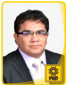
Dip. Armando Soto Espino.

“2013. Año del Bicentenario de los Sentimientos de la Nación”